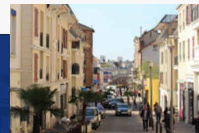
Centre-ville de Villiers-sur-Marne