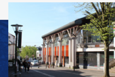
Marché couvert de Villiers-sur-Marne

À seulement 15 kilomètres de Paris, Villiers-sur-Marne est une ville en pleine expansion qui a su conserver son âme de village. Son centre-ville animé par de nombreux commerces et services, son marché couvert et sa desserte en transport efficace donnent à cette ville une qualité de vie optimale.