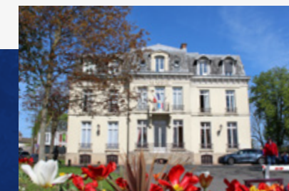
Mairie de Villiers-sur-Marne